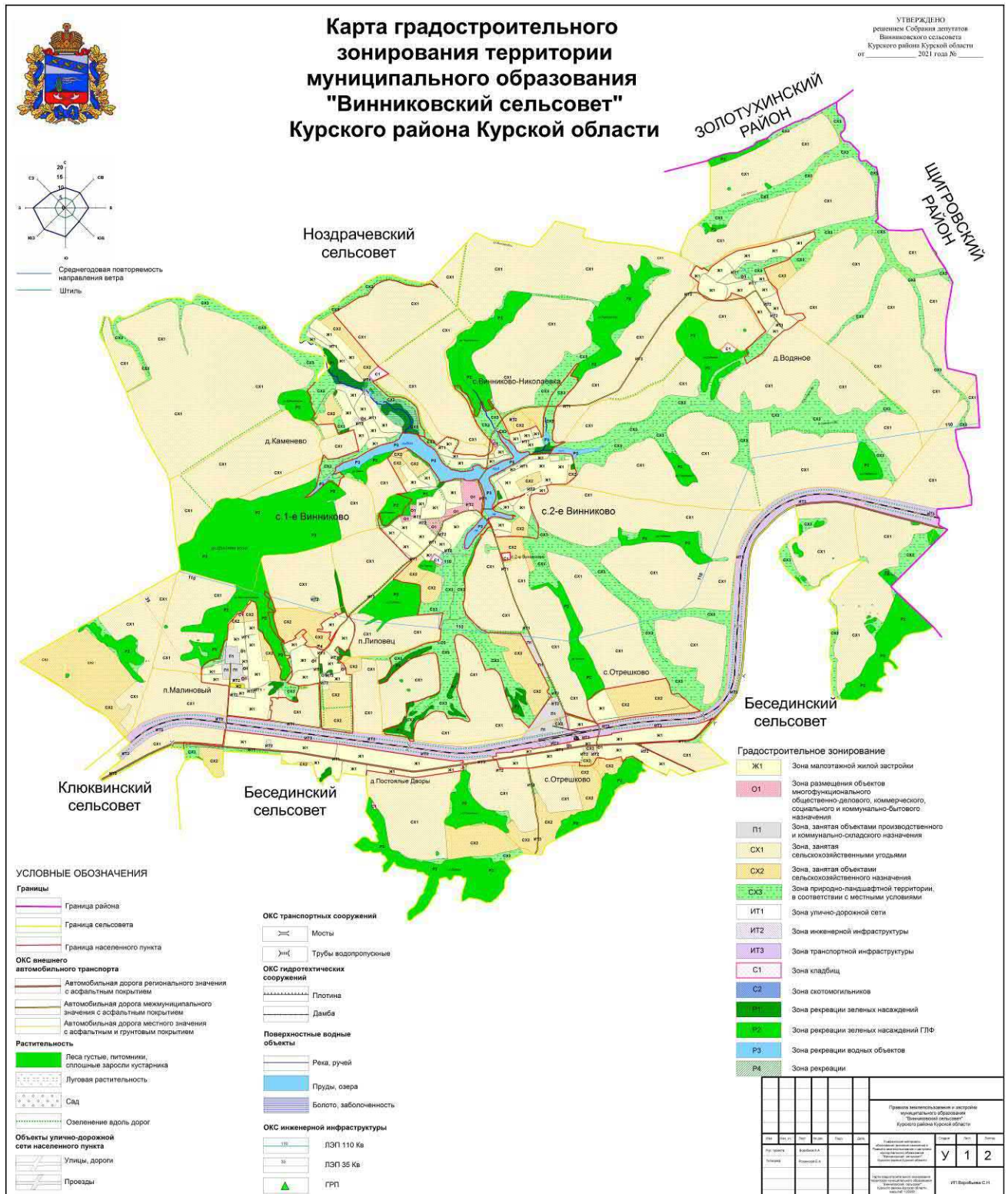
Рис.1. Карта градостроительного зонирования территории муниципального образования «Винниковский сельсовет» Курского района Курской области